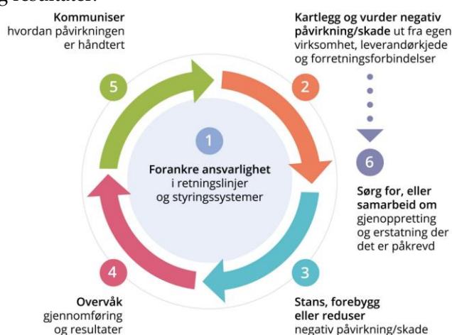
Seks trinn modell

Coldwater Prawns of Norway AS skal gjennomføre aktsomhetsvurderinger regelmessig og vurderingene skal stå i forhold til virksomhetens størrelse, virksomhetens art, konteksten virksomheten finner sted innenfor, og alvorlighetsgraden av og sannsynligheten for negative konsekvenser for grunnleggende menneskerettigheter og anstendige arbeidsforhold.